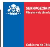
Sernageomin - Red Nacional de Vigilancia Volcánica Mapa de Peligros Volcánicos - Marzo 2024 Volcán Villarrica - Alerta Técnica Amarilla