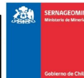
Sernageomin - Red Nacional de Vigilancia Volcánica Mapa de Peligros Volcánicos - Noviembre 2023 Volcán Villarrica - Alerta Técnica Amarilla