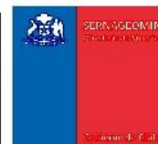
Sernageomin - Red Nacional de Vigilancia Volcánica Mapa de Peligros Volcánicos - Mayo 2023 Volcán Villarrica - Alerta Amarilla