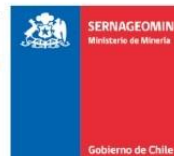
Sernageomin - Red Nacional de Vigilancia Volcánica Mapa de Peligros Volcánicos - Mayo 2023 Volcán Villarrica - Alerta Amarilla