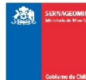
Sernageomin - Red Nacional de Vigilancia Volcánica Mapa de Peligros Volcánicos - Julio 2022 Volcán Villarrica - Alerta Verde