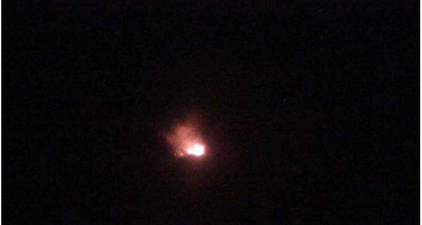
Ilustración 2- Actividad superficial, se observa emisión de material piroclástico incandescente.

NevChillan_Portezuelo 2021-07-05 05:31:50 UTC OVDAS sernageomin