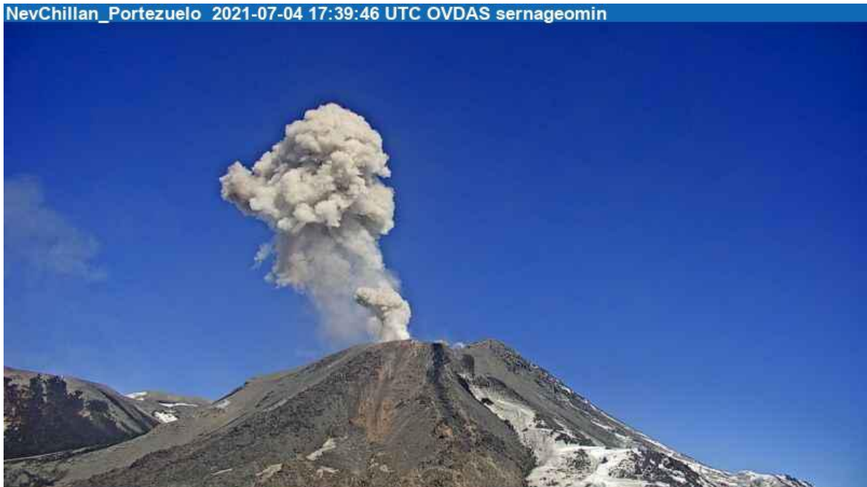
Ilustración 2- Actividad superficial, se observa emisión de gases y material particulado.