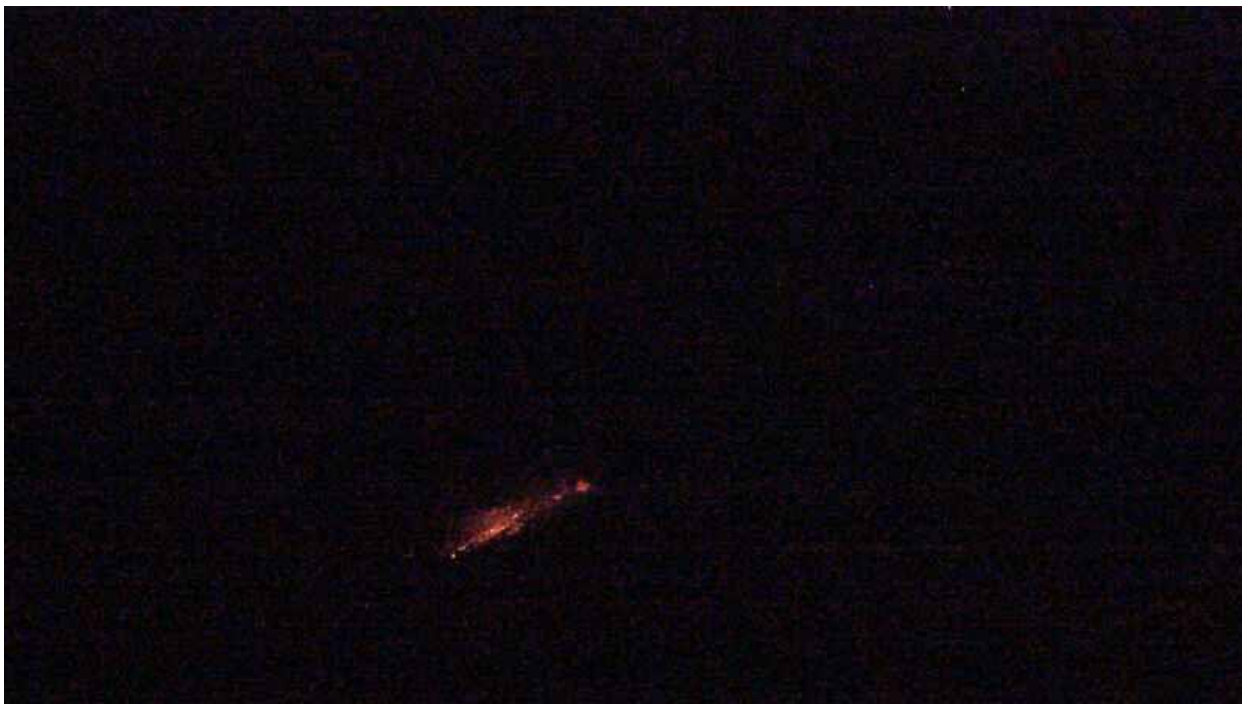
Fig. 2. Actividad superficial asociada con la explosión. Nótese la incandescencia en colores rojizos.

ALTURA DE COLUMNA MÁXIMA: 60 metros sobre punto de emisión DIRECCIÓN DE DISPERSIÓN: No se visualiza